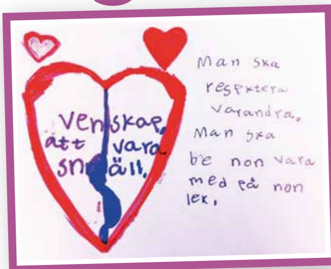
Engelska skolan i Upplands Väsby skickade ett stort kuvert med teckningar om vänlighet som vi blev extra glada för. TACK!

■ Det finns ingen motsättning mot att vara vänlig i sin vardag och att bry sig om människor längre bort. I år hade vi en vänlighetsutmaning på nätet som över 600 personer deltog i. Radio, tv och tidningar över hela landet uppmärksammade Vänliga Veckan och vi hoppas att du som läser det här fick känna av extra vänlighet. Annars är det inte försent. Vänlighet kräver ju ingen speciell vecka utan fungerar utmärkt året om.