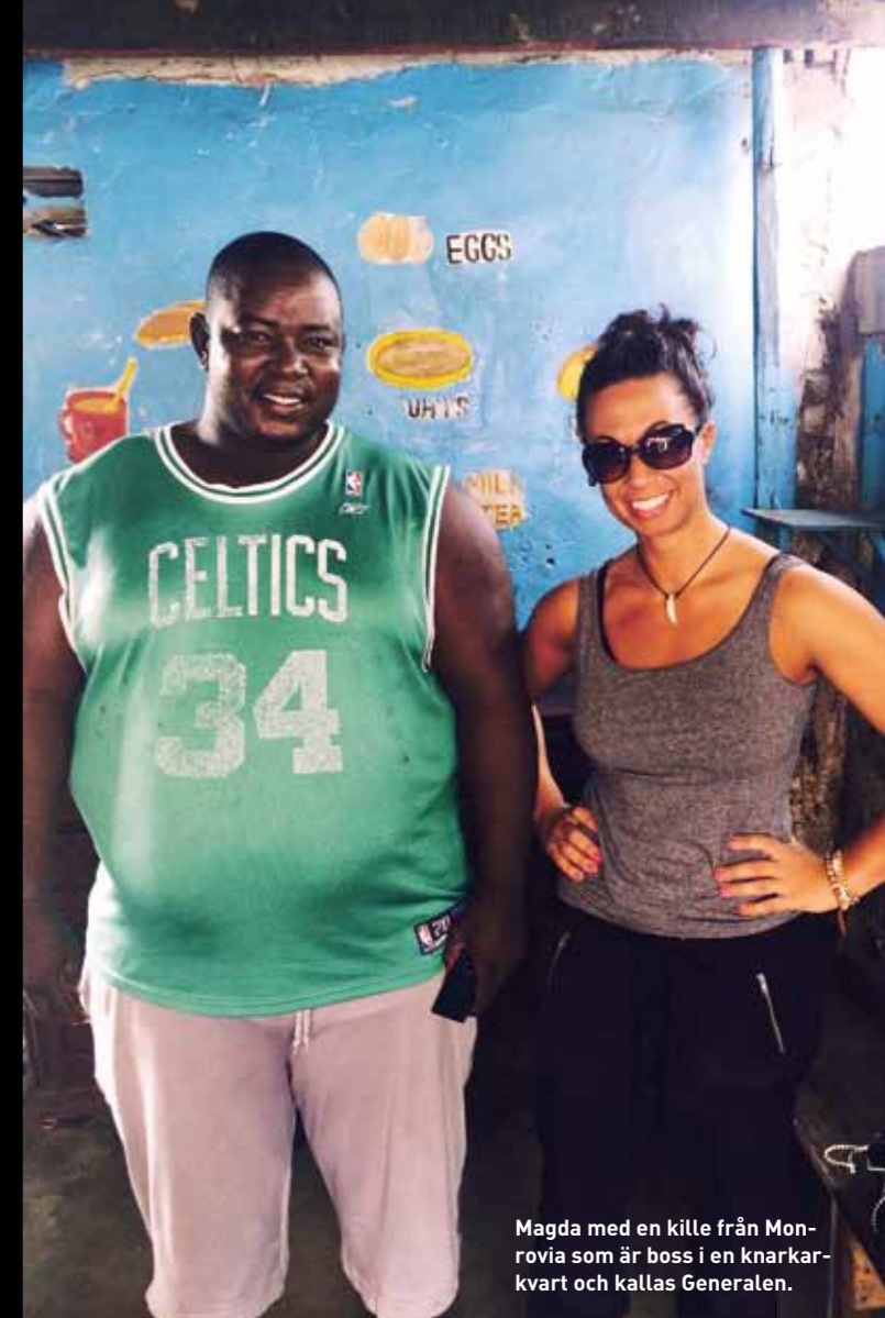
Magda med en kille från Monrovia som är boss i en knarkarkvart och kallas Generalen.

Om att landa i Sverige efter resor i tuffa miljöer: "När jag då hör någon klaga på att skummet i deras caffelatte är fel, eller ser barn som gråter för att de inte får något i affären eller möter såna som bara måste ha det senaste i modeväg, då kan jag börja tycka illa om folk, sådant kan väcka aggressioner i mig när jag vet att 6-8 timmars flygresa härifrån finns det barn som aldrig kan le."