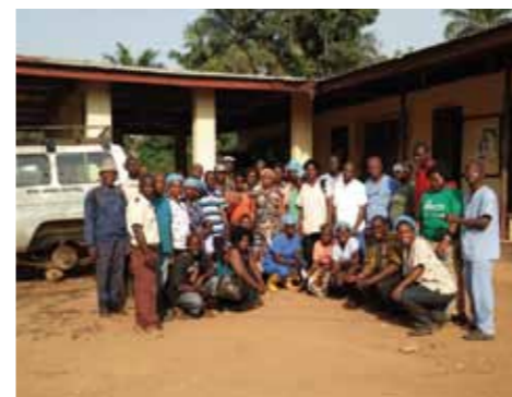
Personalen på Foyasjukhuset i Liberia.