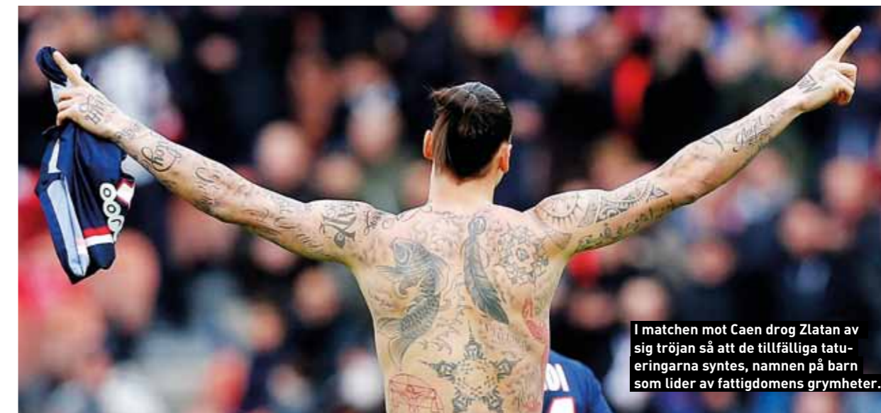
I matchen mot Caen drog Zlatan av sig tröjan så att de tillfälliga tatueringarna syntes, namnen på barn som lider av fattigdomens grymheter.

– Ett gilla på facebook förändrar inte världen, lägger P-M till. ■